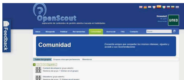
Fig. 1. Página de la comunidad del portal OpenScout.

impulsando la participación activa en el movimiento de democratización de la educación [1].