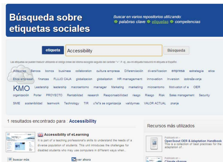
Fig. 4. Búsqueda sobre etiquetas sociales.

Desde la misma ventana donde se etiquetan, califican y se comparten recursos con otras redes sociales, se pueden añadir comentarios, cumplimentando un sencillo campo de texto y, una vez hecho, pulsando un botón “Envío”.