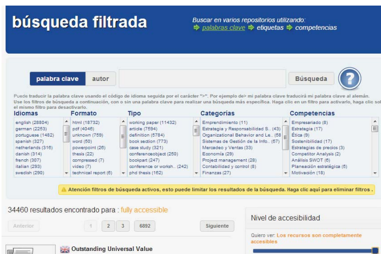
Fig. 2. Resultados de la búsqueda de recursos completamente accesibles.

El acceso a la selección de accesibilidad se realiza mediante una barra horizontal que desafortunadamente no tiene acceso por teclado.