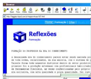
Figura 2 – Texto e Mapa Virtual elaborado no Nestor Web Cartographer

No segundo momento, podemos ver, na representação gráfica do mapa e nas anotações, quais foram as articulações criadas pelo leitor com as informações que encontrou durante a navegação e com suas experiências ou seus conhecimentos prévios. Todas as articulações e informações podem ser sintetizadas num documento criado pelo leitor, inclusive o próprio mapa de navegação pode ser inserido neste arquivo e também publicado na Internet.