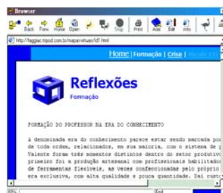
Figura 2 – Texto e Mapa Virtual elaborado no Nestor Web Cartographer

No segundo momento, podemos ver, na representação gráfica do mapa e nas anotações, quais foram as articulações criadas pelo leitor com as informações que encontrou durante a navegação e com suas experiências ou seus conhecimentos prévios. Todas as articulações e informações podem ser sintetizadas num documento criado pelo leitor, inclusive o próprio mapa de navegação pode ser inserido neste arquivo e também publicado na Internet.