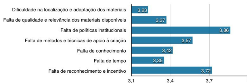
Gráfico 2: Escore médio dos itens avaliados

Ressalta-se que quanto maior for o resultado de EM (ou seja, quanto mais próximo de 4), maior será o nível de importância do item de acordo com a opinião dos participantes. Nesse sentido, o EM para o item “ falta de reconhecimento e incentivo ” foi de 3,72 , estando bem próximo do valor 4. Os EMs para os demais itens avaliados foram calculados seguindo-se os mesmos critérios.