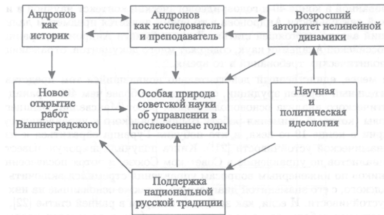
Рис. 2. Блок-схема, показывающая некоторые факторы, влиявшие на советскую науку об управлении в послевоенные годы.

науки и техники и защитить национальные приоритеты в научных открытиях и изобретениях.”