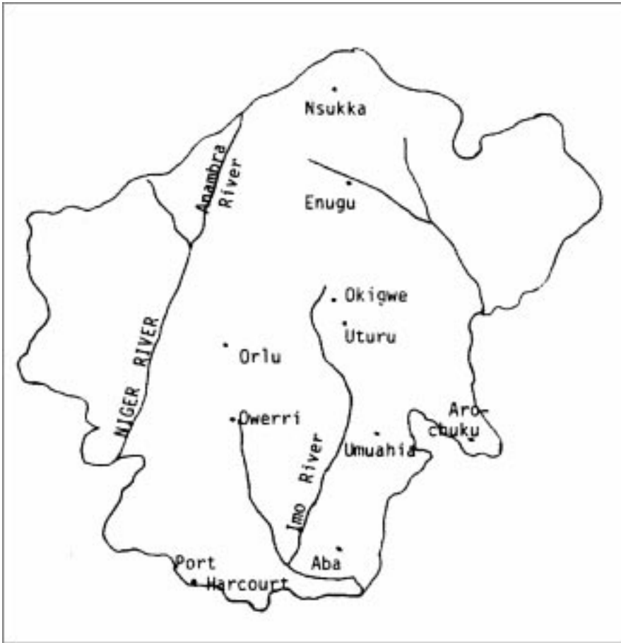
CARTE 2. — Map of Igbo Speaking Area.