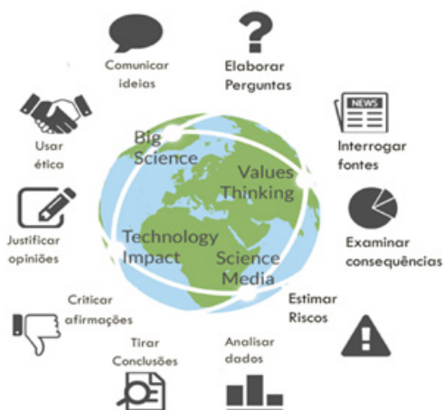
Figura 1 - Habilidades definidas no Projeto Europeu ENGAGE