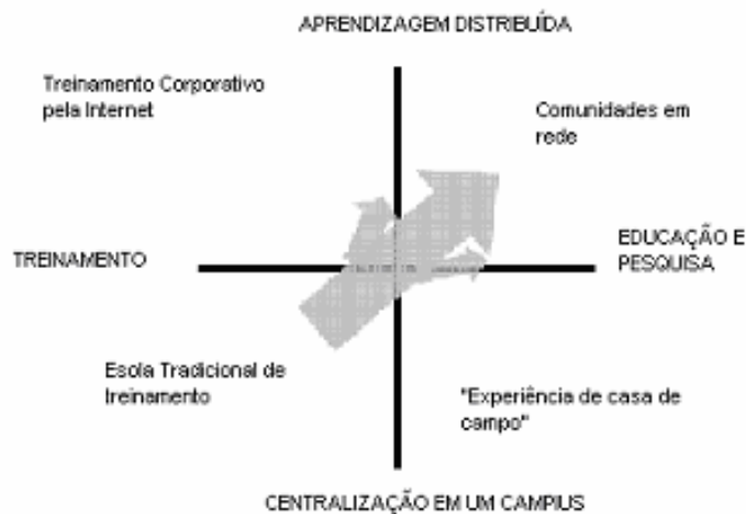
Fig.2 Tipologia das UCs

Combinando essas duas dimensões destacam-se 4 diferentes tipos de UCs. Ilustradas na Fig.2, indicando qual a modalidade de resultado que se pode esperar de cada tipo.